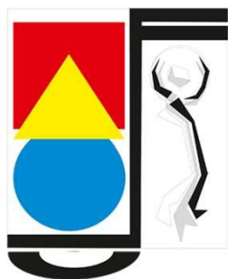
COLEGIUL NATIONAL DE ARTA „OCTAV BANCILA” - IASI

Istituto Nazionale d'Arte "Octav Bancila" - RO